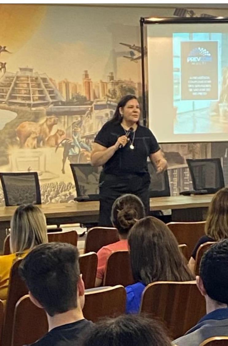
São José do Rio Preto/SP

A fundação continua a intensificar sua presença e relacionamento junto aos estados e municípios onde atua. Entre outubro e dezembro de 2025, nossas lideranças estiveram em Belém/PA, São José do Rio Preto/SP e Cuiabá/MT, além da câmara municipal de São Paulo.